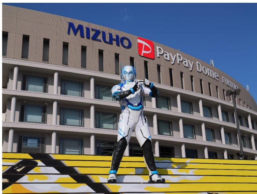
※ソフトバンクホークス今季スローガンであるピース「PS!」マークのオーガマン

このたび、エンタメ『薬剤戦師オーガマン・ドゲンジャーズ』と、スポーツ『福岡ソフトバンクホークス』の力を掛け合わせることで、地域の皆さまにより多くの元気と笑顔を届けたい、また福岡という街の魅力を向上させたいという想いのもと、パートナーシップを締結する運びとなりました。